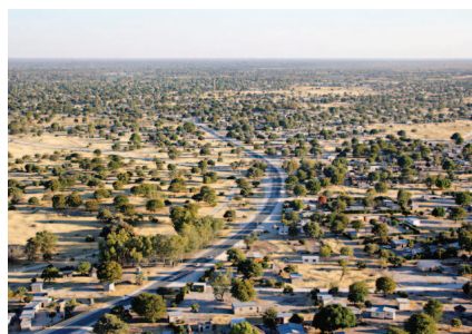
Vue aérienne de Maun, la porte du delta de l'Okavango

Cette petite ville est le point d'arrivée ou de départ de tout safari au Botswana. Elle s'est considérablement développée ces dernières années et est considérée comme la capitale du safari.